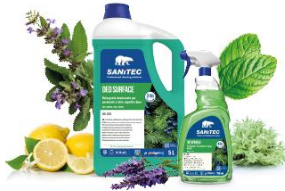
AROMATICO LEGNOSO AROMATIC WOODY Cod. 2203 | 2302