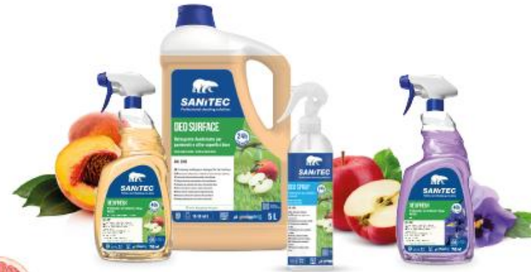
FRUTTATO FLOREALE FRUITY FLORALS Cod. 2205 | 2305 | 2404