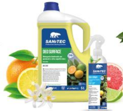
AGRUMATO CITRUS Cod. 2202 | 2402